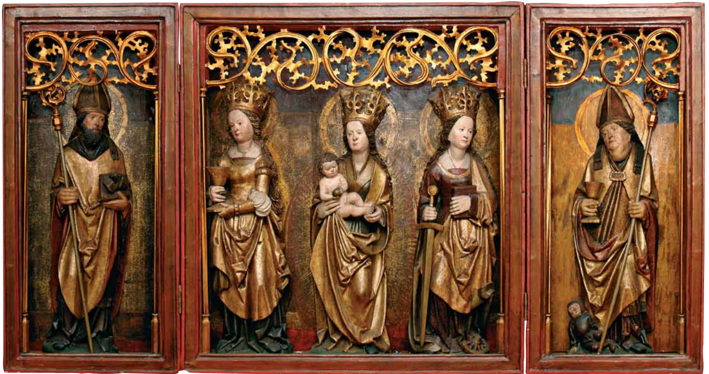
10. Tryptyk z Łądu , stan obecny. 10. Triptych from Łądu , present-day state.