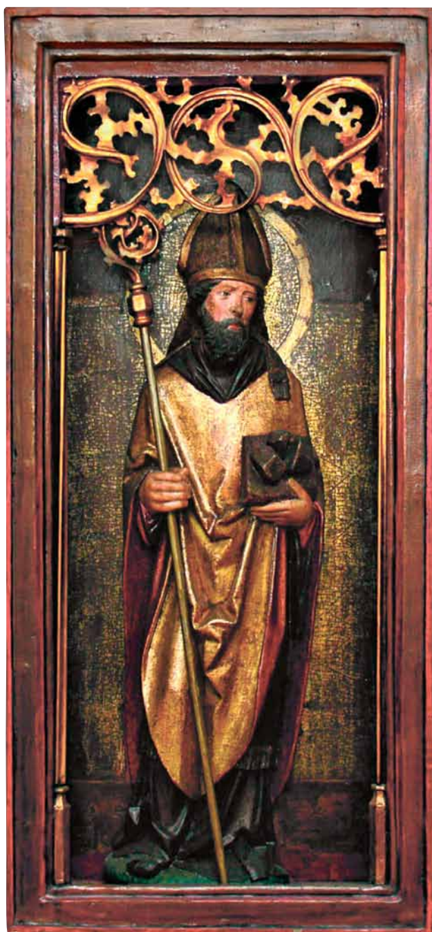
12. Prawe skrzydło tryptyku z figurą św. Mikołaja, stan obecny.