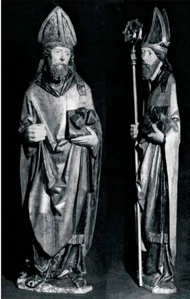
4. Św. Mikołaj z Miry, stan w trakcie konserwacji.

Stan zachowania zabytku nie pozwalał na jego ekspozycję w Łądzie, stąd zapewne decyzja o złożeniu go