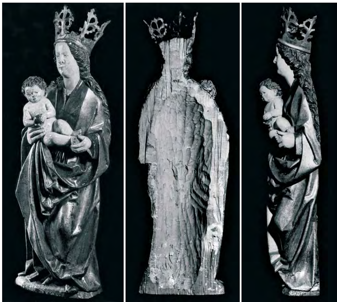
1. Maria z Dzieciątkiem, stan w trakcie konserwacji.

Wyższego Seminarium Duchownego Towarzystwa Salezjańskiego, natrafiłem na klasztorным strychu na późnogotycki rzeźbiony tryptyk z figurami Marii z Dzieciątkiem (il. 1) oraz świętych: Barbary (il. 2),