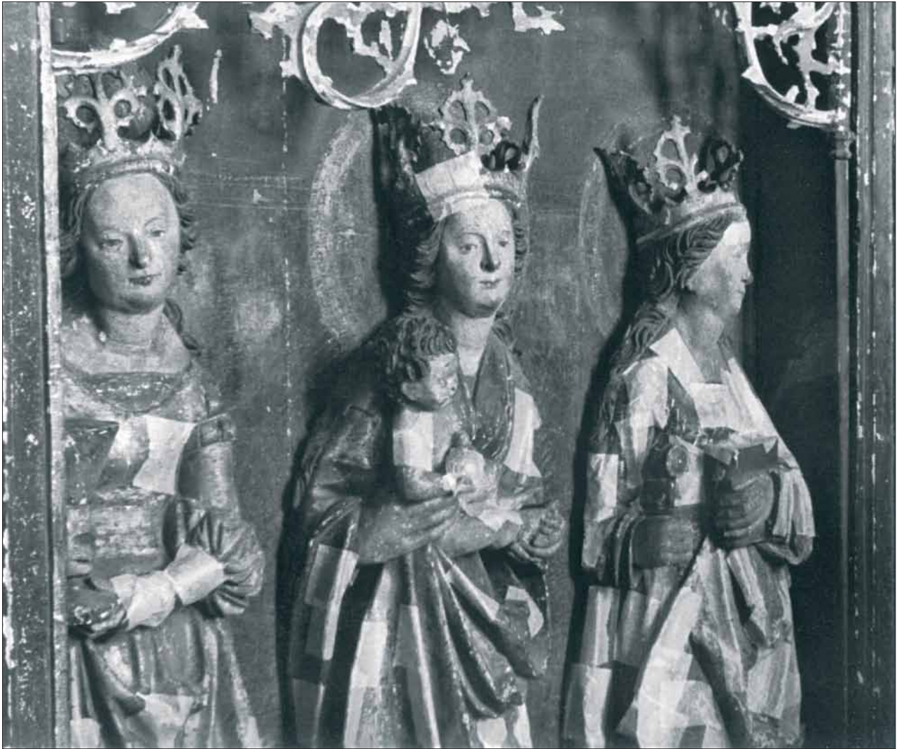
8. Skrzynia główna – fragment, stan przed konserwacją. 8. Main chest – fragment, state before conservation.

św. Stanisławem zachowało się, nowożytnie w formie, olejne malowidło prezentujące św. Szczepana na tle rozpiętej draperii (il. 9).