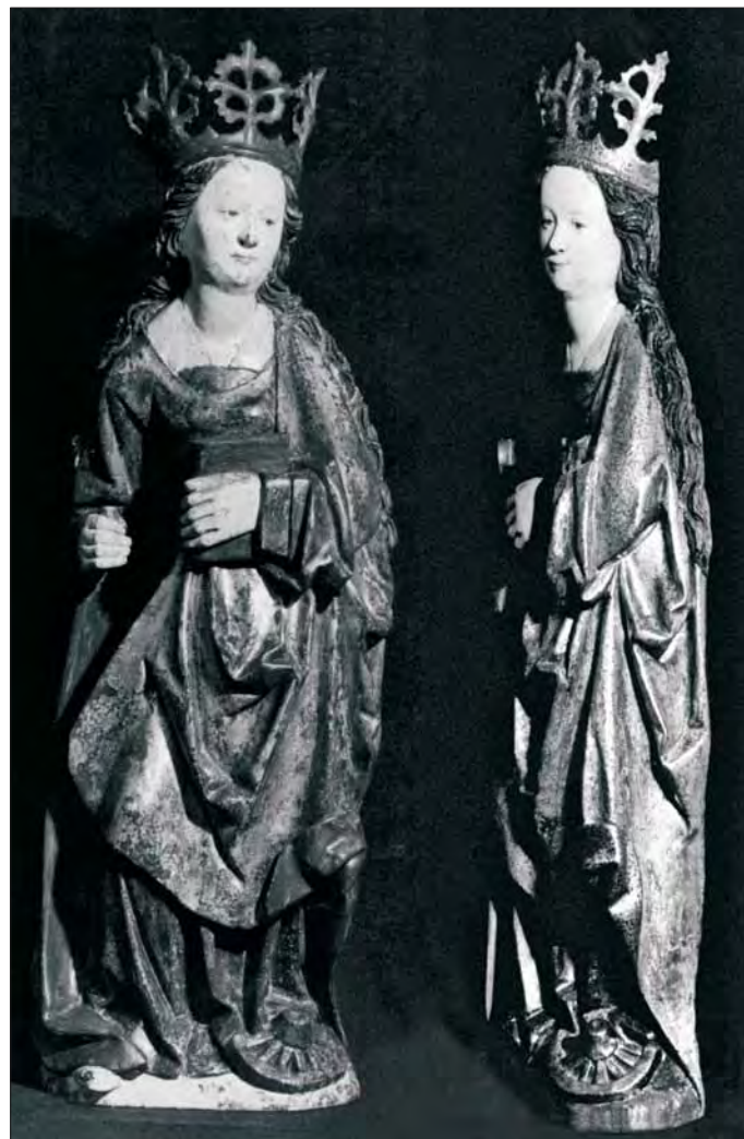
3. Św. Katarzyna Aleksandryjska, stan w trakcie konserwacji. 3. St. Catherine of Alexandria, state during conservation.

mieszkańców klasztoru w Łądzie nie potrafił wyjaśnić, w jaki sposób to niezwykle dzieło gotyckiej snycerki znalazło się w tym miejscu. W Kronice Wyższego Seminarium Duchownego w Łądzie odnalazłem informację, że tryptyk trafił tu w 1969 r. jako dar proboszcza jednej z parafii na ziemi lubuskiej: „W drodze powrotnej z wizytacji domów ośrodka Kaława zatrzymał się na nocleg ks. insp. Świada. Przywiózł do domu łądzkiego środkową część pięknego gotyckiego tryptyku. Jest to dar jednego