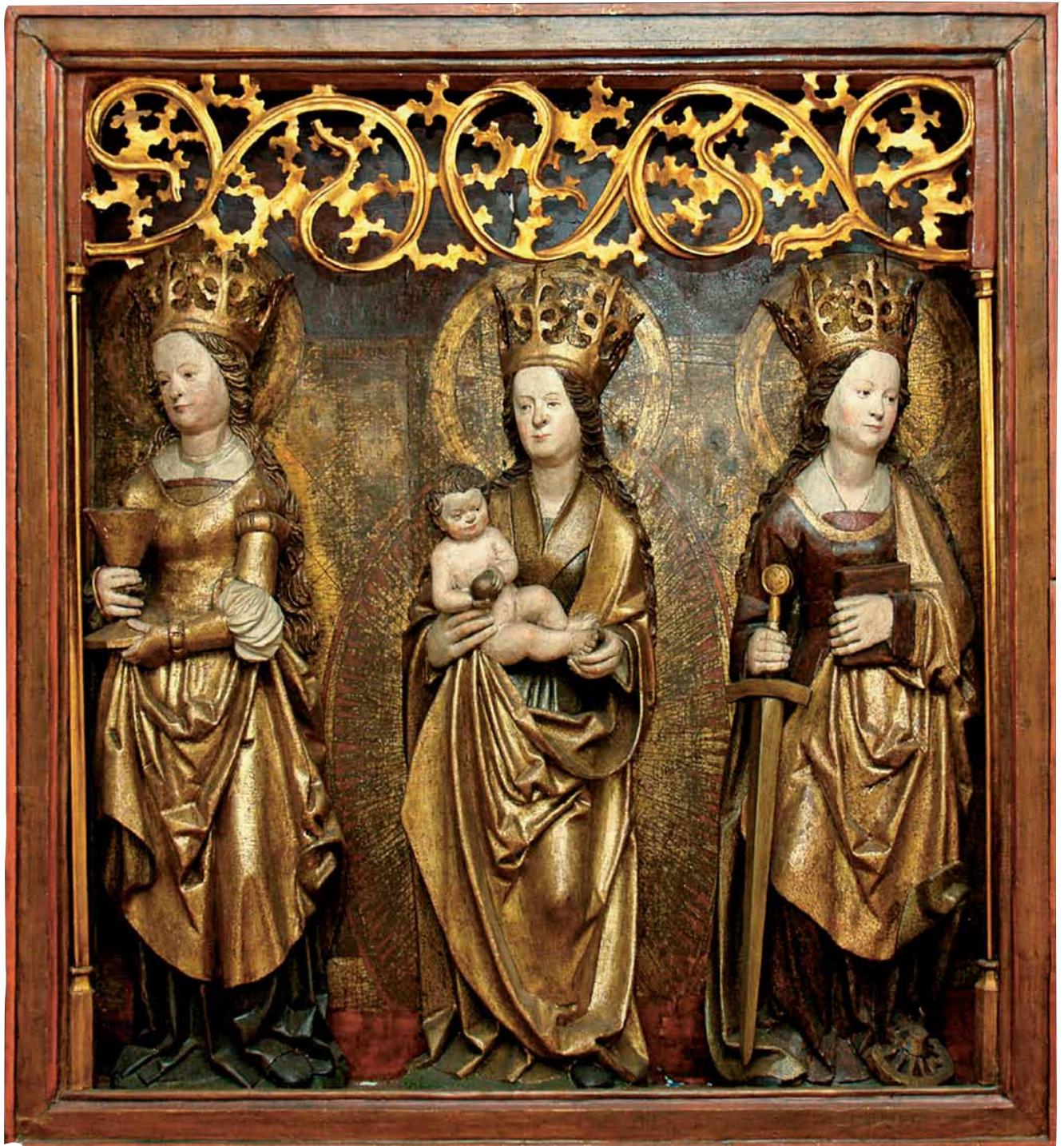
11. Skrzynia główna, stan obecny. 11. Main chest, present-day state.

odziana w długą szatę spodnią (alba?) oraz szatę wierzchnią sięgającą kolan, dekorowaną wyrazistym motywem ornamentalnym (dalmatyka?), z palmą w lewej ręce. Można przypuszczać, że na niezachowanym rewersie skrzydła lewego mógł być ukazany symetrycznie św. Wawrzyniec.