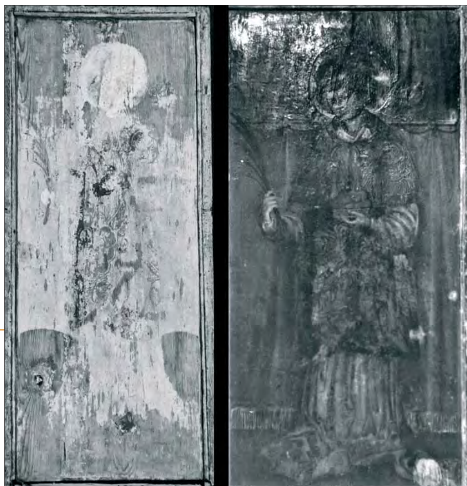
9. Św. Szczepan, rewers lewego skrzydła, stan przed i po konserwacji. 9. St. Stephen, reverse of the left wing, state before and after conservation.

oraz, w części środkowej, srebrną folię opracowaną ornamentalnie radełkiem i laserowaną złocistym lakierem. Kręgi aureoli za głowami postaci wyzłocono złotą folią na wysoki poler. Polerowanym złotem pokryto również, wycięte w lipowym drewnie, roślinne ornamenty oraz wspierające je na krawędziach laskowania. Każdy z trzech ażurowych fragmentów wici wycięto z jednego kawałka lipowej deski. Figury tryptyku zostały wyrzeźbione z jednorodnych kawałków drewna lipowego, wydrążonych na rewersach ciosłem (il. 1). W miejscach narażonych na spękanie naklejono paski lnianego płótna. Powierzchnię drewna pokryto zaprawą klejowo-kredową o grubości od 0,5 do 1,5 mm. Rzeźby wyzłocono i wysrebrzono na wysoki poler. Złoto ma odcień chłodny, co może wskazywać na jego niską próbę z dużą domieszką srebra. Niektóre z wysrebrzonych partii szat były laserowane kraplakiem i prawdopodobnie miedzianką (obecnie pociemniała, brunatna) oraz lakierami złocistymi mającymi imitować złoto. Karnacje twarzy i dłoni zostały wykonane tłustą temperą.