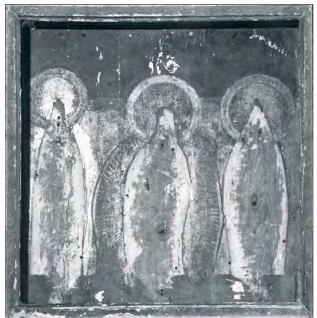
7. Zaplecek skrzyni głównej, stan przed konserwacją.

i osypane, zaś partie polichromowane ram oraz tła powyżej i poniżej powierzchni wyłoczonej przemalowane na kolor błękitny i czerwony, z licznymi rysami, odwarstwieniami i odpryskami (il. 7). Figury stały zamocowane w skrzyniach, jednak odwrócone na zewnątrz głowy stojących obok Madonny świętych dziewic oraz biskupów w skrzydłach bocznych wskazywały na ich wtórne zestawienie z zamianą miejsc (il. 8). Rzeźby tryptyku zachowały się w dobrym stanie, z wyjątkiem ubytków w ażurowych koronach Marii i świętych dziewic, braku jelca i głowni miecza przy figurze św. Katarzyny, braku prawej dłoni i pastorału w figurze św. Mikołaja oraz pastorału w figurze św. Stanisława. Złocenia szat postaci posiadały liczne drobne ubytki i odspojenia, na partiach srebrzonych, mocno szerniałych, widoczne były ślady pierwotnych laserunków. Polichromowane partie rzeźb – dłonie i karnacje twarzy – przemalowano. Również wywinięte partie szat przemalowano na niebiesko i czerwono. Powierzchnię figur pokrywał poślółkły lakier olejny. Na rewersie skrzydła ze