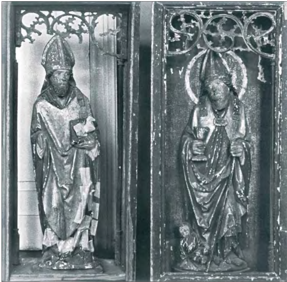
6. Skrzydła boczne tryptyku, stan przed konserwacją.