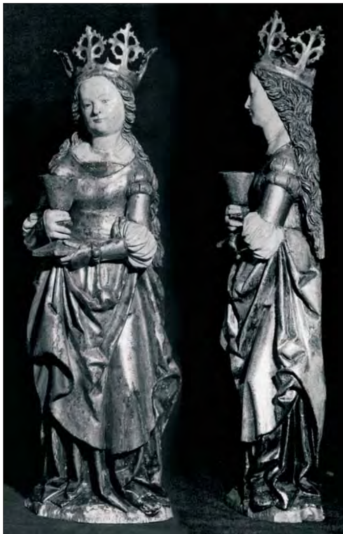
2. Św. Barbara, stan w trakcie konserwacji. 2. St. Barbara, state during conservation.

z proboszczów parafii na ziemi lubuskiej. Tryptyk, choć piękny, wymaga starannej renowacji 22 . Zapis w Kronice... dokumentuje przywiezienie do Łądu środkowej części tryptyku – skrzyni głównej. Nie ma informacji, kiedy trafiły tu skrzydła boczne.