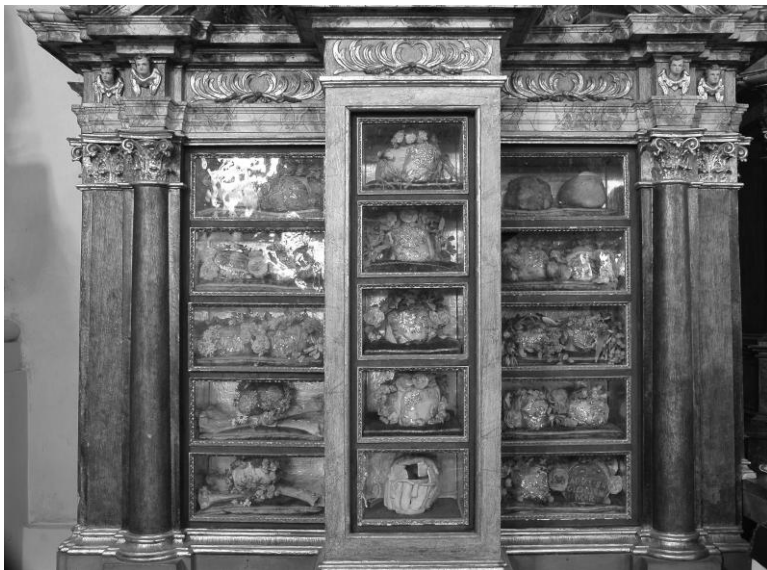
5. Prawy cokół ołtarza z niszami eksponującymi relikwie głów męczenniczek z Orszaku św. Urszuli.