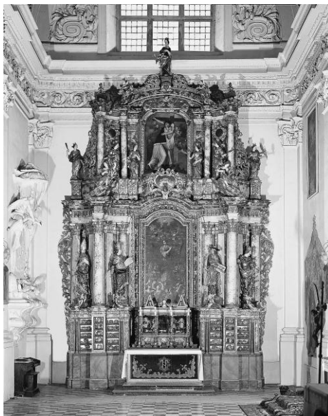
4. Ołtarz-relikwiarz Św. Urszuli i jej Towarzyszek w Łądzie, warsztat Ernesta Brogera 1721 r.