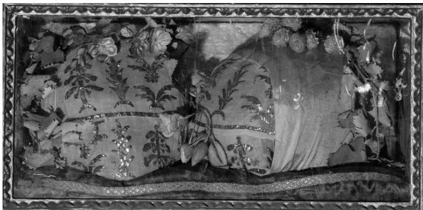
7. Para relikwii głów z cokołu ołtarza w oprawie tkanin z 1852 r., na licu użyte fragmenty tkaniny wcześniejszej haftowanej srebrną taśmą.