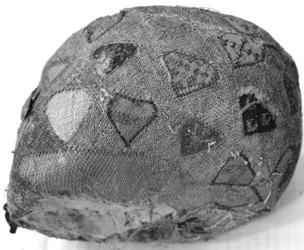
8. Czaszka okryta złotolitą tkaniną dekorowaną tarczami ze znakami herbowymi. Fotografia autor.