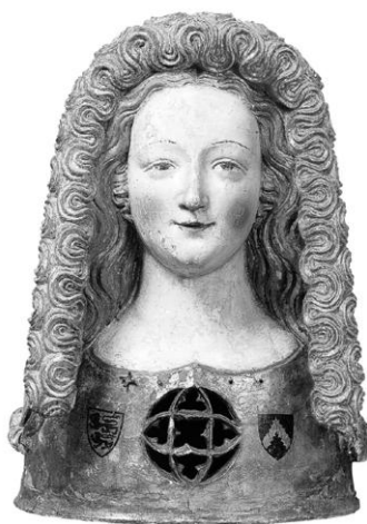
2. Przykład relikwiarza w typie Ursulabüste z Museum Schnütgen w Kolonii z ok. 1350. Fotografia z archiwum autora.