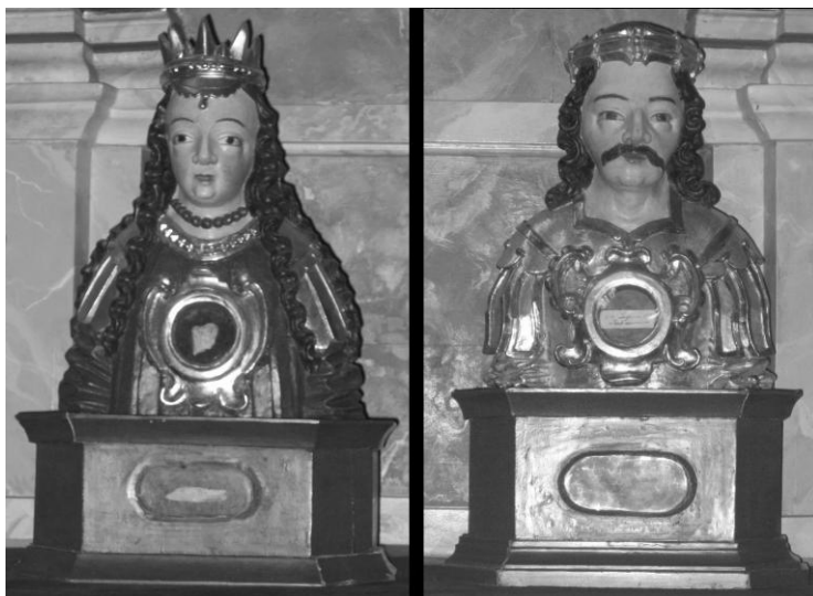
3. Dwa z zespołu 24 popiersi relikwiarzowych z kościoła w Łądzie, obecnie w kościele parafialnym w Zagórowie, 3. ćwierć XVII w.