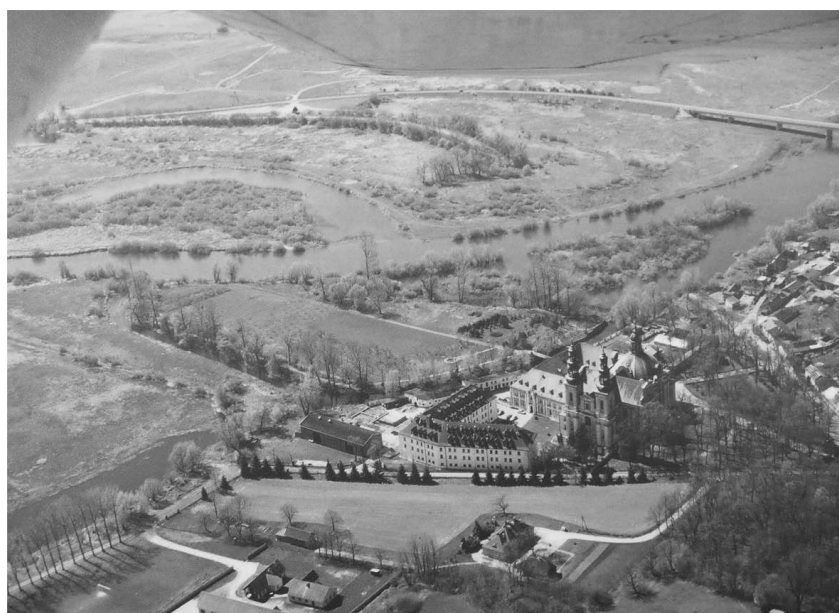
Rys. 4. Dawne opactwo cysterskie w Łądzie nad Wartą, widok od strony północno-wschodniej, u dołu teren dawnego ogrodu opackiego, w głębi ogród na wyspie, po prawej park przykościelny Fig. 4. The former Cistercian abbey in Łódź upon Warta, view to the northeast, former abbot garden (down), a garden on the island and a church park