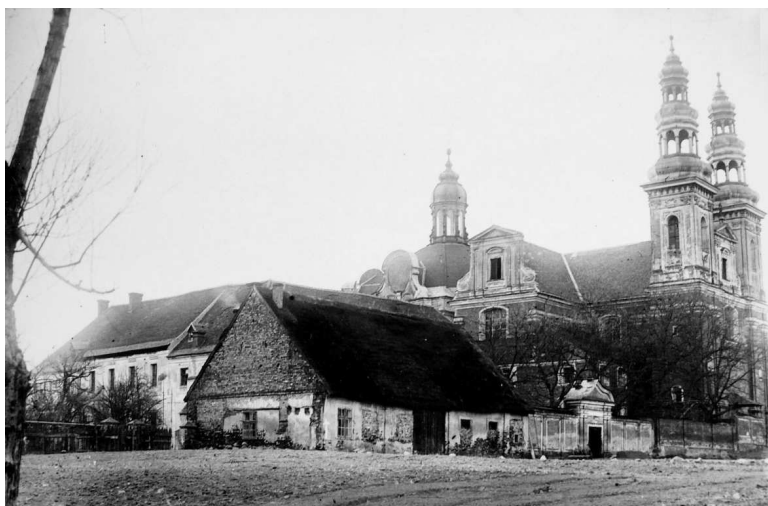
Rys. 6. Widok opactwa w Łądz od strony południowo-wschodniej, teren po rozebranych pałacu opata łukomskiego i południowej części opackiego ogrodu z widoczną pozostałością parteru oficyny pałacu, zdjęcie z ok. 1910 r.

fotografia z ok. 1910 roku (rys. 6). Na tym miejscu, w latach 30. XX w., stanęły budynki gospodarcze, rozbudowane w latach 1957–1968 31 . Pod koniec XX w. i w 2007 roku większość budynków gospodarczych została rozebrana.