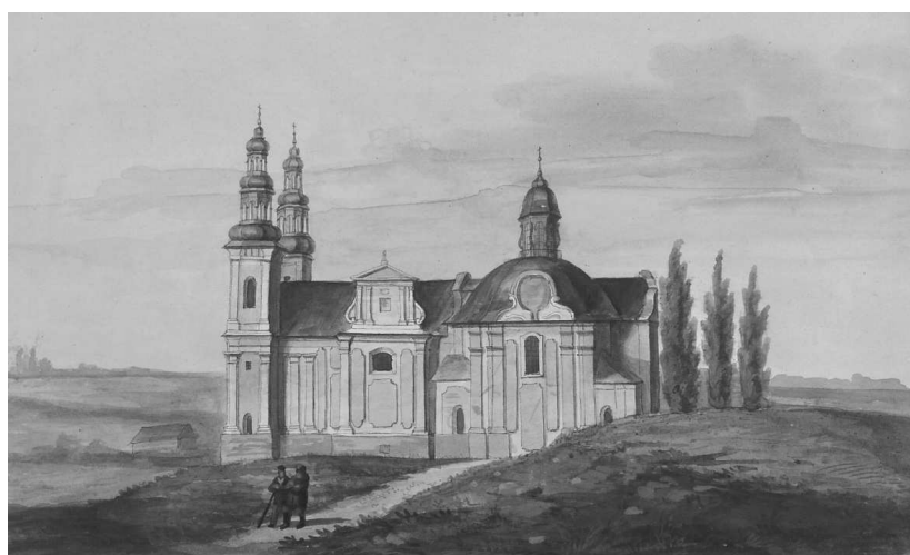
Rys. 7. Adam Lerue, Kościół po Cysterski w Łądzie , ok. 1846 r., akwarela.

Nie posiadamy informacji o losie przykościelnego parku po kasacie konwentu kapucynów. Po erygowaniu parafii przy kościele klasztorным w Łądzie w 1890 r. park został przyłączony do parafialnego kościoła. W latach 1906–1910 proboszcz parafii Łądz, ks. Teodor Fibich, ogrodził teren przykościelnego parku od północy i zachodu parkanem z podmurówką i murowanymi słupkami, między którymi rozpięte zostały metalowe przęsta 39 . Ogrodzenie to, remontowane w latach 80. XX w., przetrwało do dnia dzisiejszego. W czasie II wojny, podczas stacjonowania w Łądzie zgrupowania Hitlerjugend, uległy zniszczeniu figury stojące w przykościelnym parku.