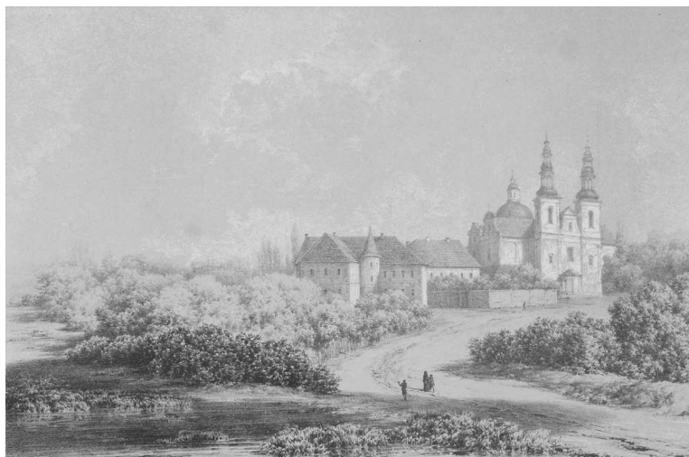
Rys. 5. Napoleon Orda, Łąd nad Wartą (Polska) gubernia kaliska , litografia ok. 1880 r. Fig. 5. Napoleon Orda, Łąd upon Warta (Polish) Kalish Gubernya , lithograph circa 1878