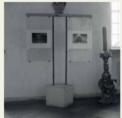
Zdjęcia powyżej dokumentują aranżację ekspozycji na krągankach.