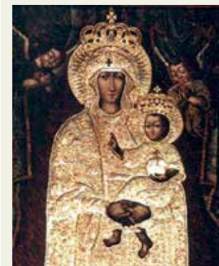
Tradycją spotkań organizowanych przez grupę „Świadectwo i Twórczość” stała się pielgrzymka do sanktuarium Matki Bożej Pocieszenia w Kawnicach, inaugurująca we wrześniu każdy nowy rok działalności grupy.